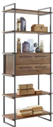
Enkel - 88cm Set van 2 metalen staanders