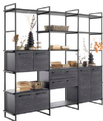
Drieluik - 244cm Set van 4 metalen staanders