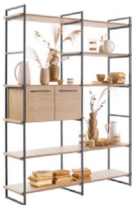
Dubbel - 166cm Set van 3 metalen staanders