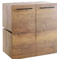
Kast met 2 deuren h80xb75xd43