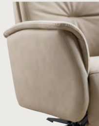
Arm 1 gesloten

Initio biedt keuze uit een gesloten of een open arm in dezelfde stof of leder als de fauteuil.