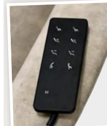
Afstandsbediening 4-motorige relaxfunctie