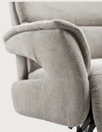
Arm 2 open