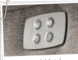
Bedieningspaneel elektrische verstelling bij armtypen 1