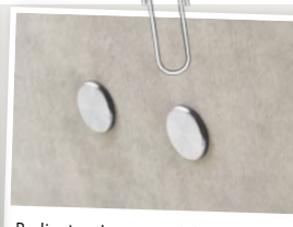
Bedieningsknoppen elektrische verstelling bij armtypen 2